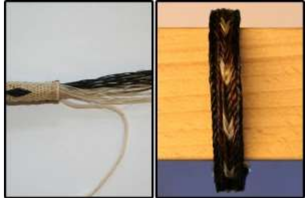
Vergleich Hitchen & Flechten

Heutzutage beschränkt sich das Hitchen nicht mehr auf die Gefängnisse, sondern wird von engagierten Künstlern und Künstlerinnen an vielen Orten der Welt ausgeübt. Das Hitchen ist eine Knotentechnik mit Pferdehaaren und sollte nicht mit dem Flechten verwechselt werden. Mit geknoteten Pferdehaaren hergestellte Produkte sind dadurch viel robuster und halten viele Jahre.